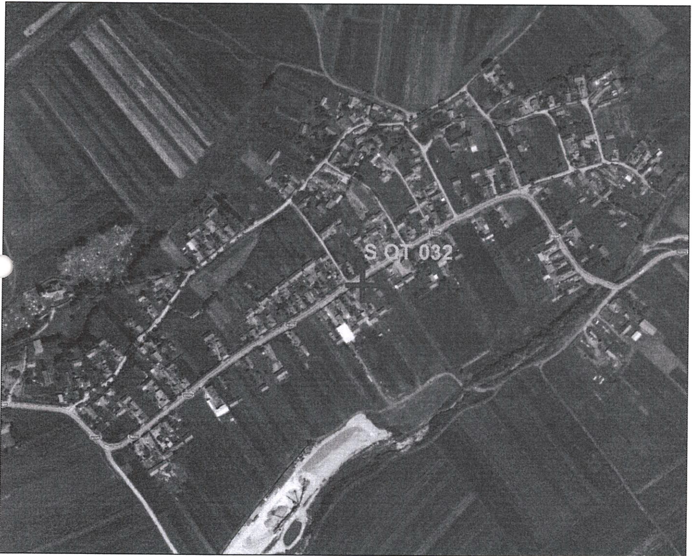
Amplasament sirenă - Faza HCL