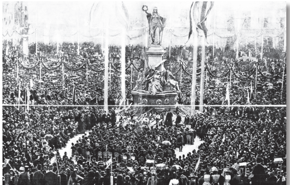
Az aradi vértanúk szobrának leleplezési ünnepsége 1890. október 6.