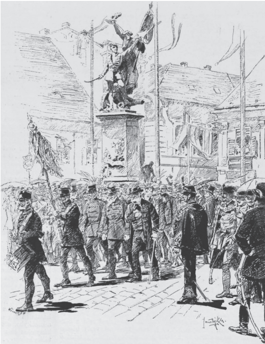
A budavári honvéd-szobor leleplezési ünnepélye: 1848/49-es honvédek elvonulása a szobor előtt. (Vasárnapi Ujság, 1893. május 28.)