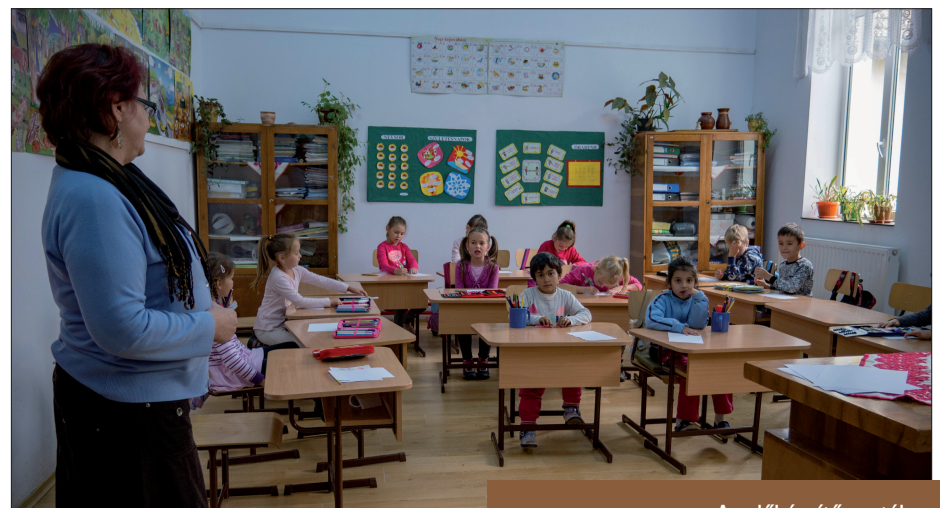
Az előkészítő osztály. Az iskola legfiatalabb tanulói

A gyerekeknek is gondot okozott volna, ha máshonnan jött volna vala-