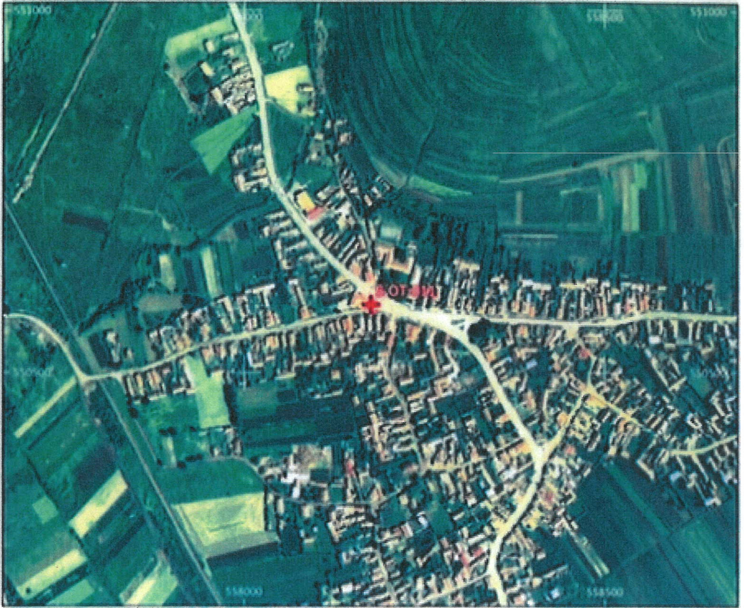
Amplasament sirenă - Faza HCE