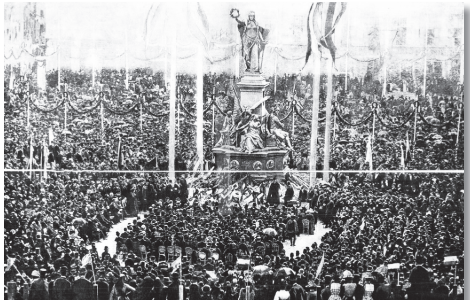
Az aradi vértanúk szobrának leleplezési ünnepe 1890. október 6. (Képes Folyóirat – A Vasárnapi Ujság füzetekben. Budapest, 1890)